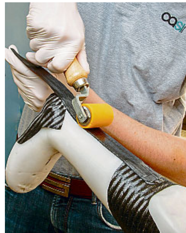
Handwerk und Technik stellen Orthopädietechniker in ihrem Beruf unter Beweis.

Rund 300 Gramm bringt eine solche Orthese im Schnitt auf die Waage – 60 Prozent weniger als früher. Zudem seien die Hilfsmittel auch optisch ansprechender. Kinder zum Beispiel freuen sich sehr, wenn sie Farbe und Muster mitbestimmen dürfen: „Ob pink oder neongrün, Blümchen oder Mickey Mouse, da ist alles möglich.“ Umso lieber würden die Orthesen getragen.